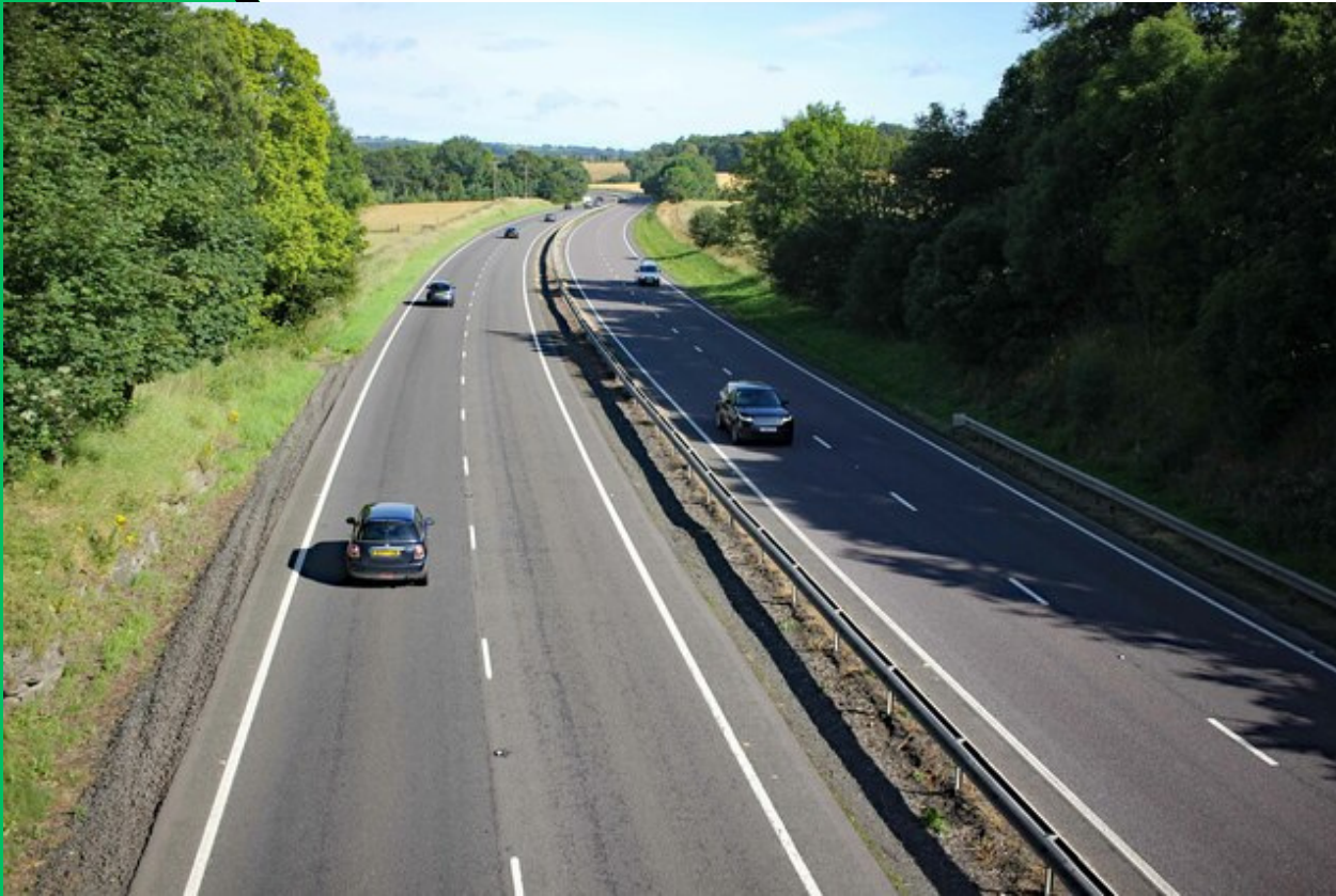
Autoroute A69, Jeff Buck, geograph, England

LAGUENS Théotime LAMBERT Simon LANFRANCHI Baptiste LE PERSON Pierre-Emmanuel LECLERC Benjamin 24/01/24