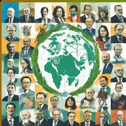
image générée par intelligence artificielle