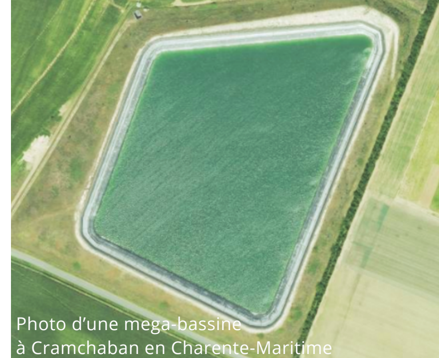
Photo d'une mega-bassine à Cramchaban en Charente-Maritime