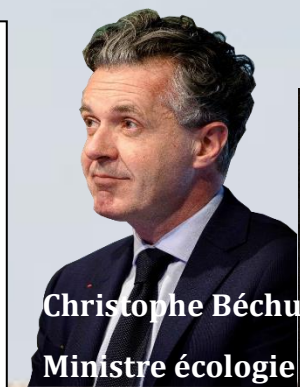
Christophe Béchu Ministre écologie

Le Bureau de Recherche Géologiques et Minières a développé un modèle régional de gestion des nappes pour aider à la décision en estimant les volumes d'eau prélevables.