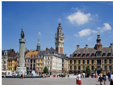
FIGURE – Adu (Maldives/ Lille)