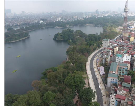
Lac Bả Mẫu

Beaucoup de logements : airbnb, groupes facebook, bouche à oreille (moins de 300€)