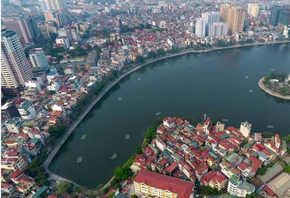
Quartier de Đống Đa