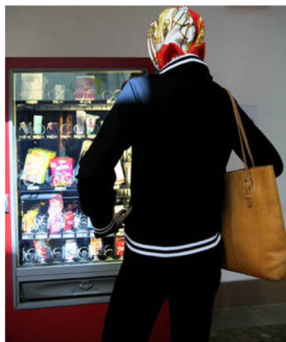
La machine à rêve de Kader Attia.

En France, on peut conjuguer plusieurs appartenances culturelles, sociales, linguistiques... On peut être français et rester attaché à l'Espagne, être musulman et laïc, régionaliste et européen, citoyen de France et citoyen du monde. La France est un pays composite. Les apports et les appartenances y sont multiples et plus visibles. La diversité y est amplifiée par les nouveaux outils de communication internationaux que sont l'internet, la télévision par satellite, le téléphone portable, la rapidité et la baisse des coûts des transports, comme par les migrations pendulaires ou les diasporas à cheval sur plusieurs pays ou continents. La diversité résulte aussi de l'histoire de France : deux siècles d'immigrations adossés, entre autres, à plusieurs siècles de colonisation.